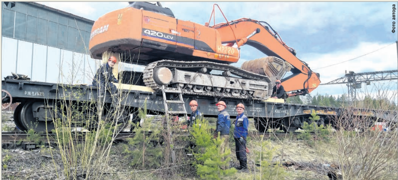
Экскаватор в апреле прибыл на комбинат из Якутии по железной дороге. А теперь машину подготовили к отправке на Рудногорский рудник

НА БАЗЕ ОБОРУДОВАНИЯ ЦСХ ПОДГОТОВИЛИ К ОТПРАВКЕ НА РУДНОГОРСКИЙ РУДНИК ЭКСКАВАТОР DOOSAN SOLAR, ПО ДОГОВОРУ АРЕНДЫ ДОСТАВЛЕННЫЙ НА КОМБИНАТ ИЗ ЯКУТИИ